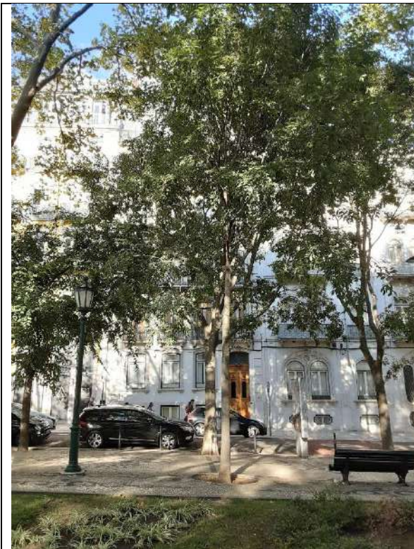
Exemplar Cod. SIG 8843 – Celtis australis