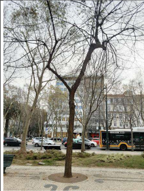
Exemplar Cod. SIG 8338 – Celtis occidentalis