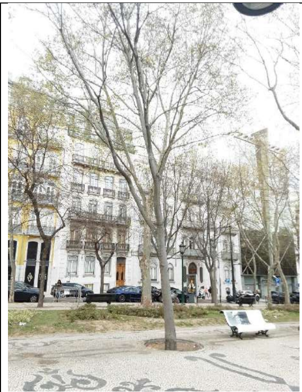
Exemplar Cod. 8627 – Celtis australis