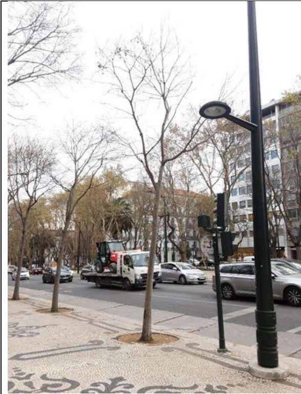
Exemplar Cod. SIG 8493 – Celtis australis