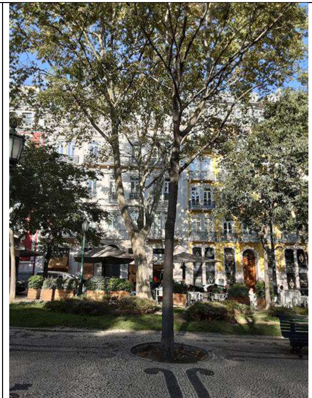
Exemplar Cod. SIG 8349 – Celtis australis