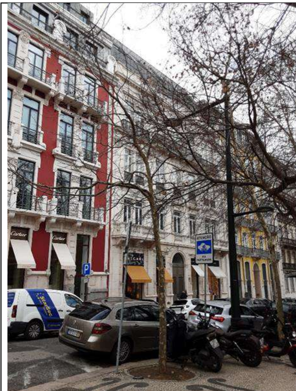
Exemplar Cod. SIG 8777 - Platanus x hybrida