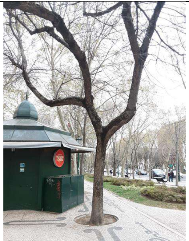
Exemplar Cod. SIG 8640 – Celtis occidentalis