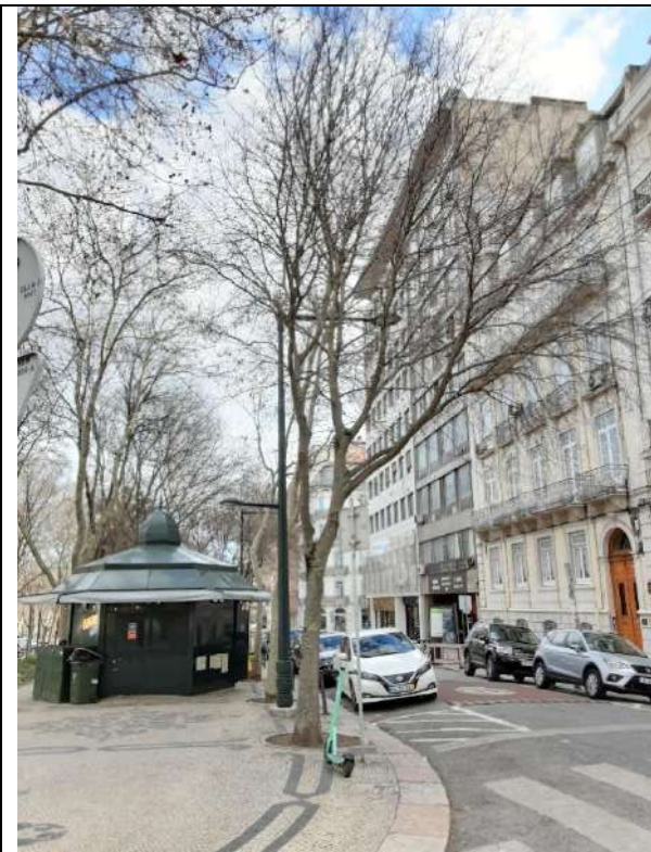
Exemplar Cod. SIG 8629 - Celtis australis