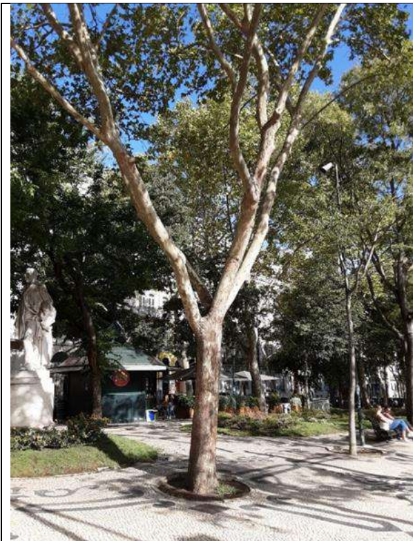
Exemplar Cod. SIG 8639 - Platanus x hybrida