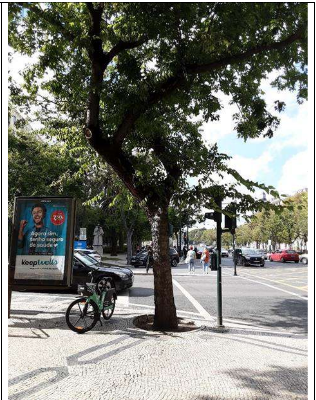
Exemplar Cod. SIG 8494 - Celtis occidentalis