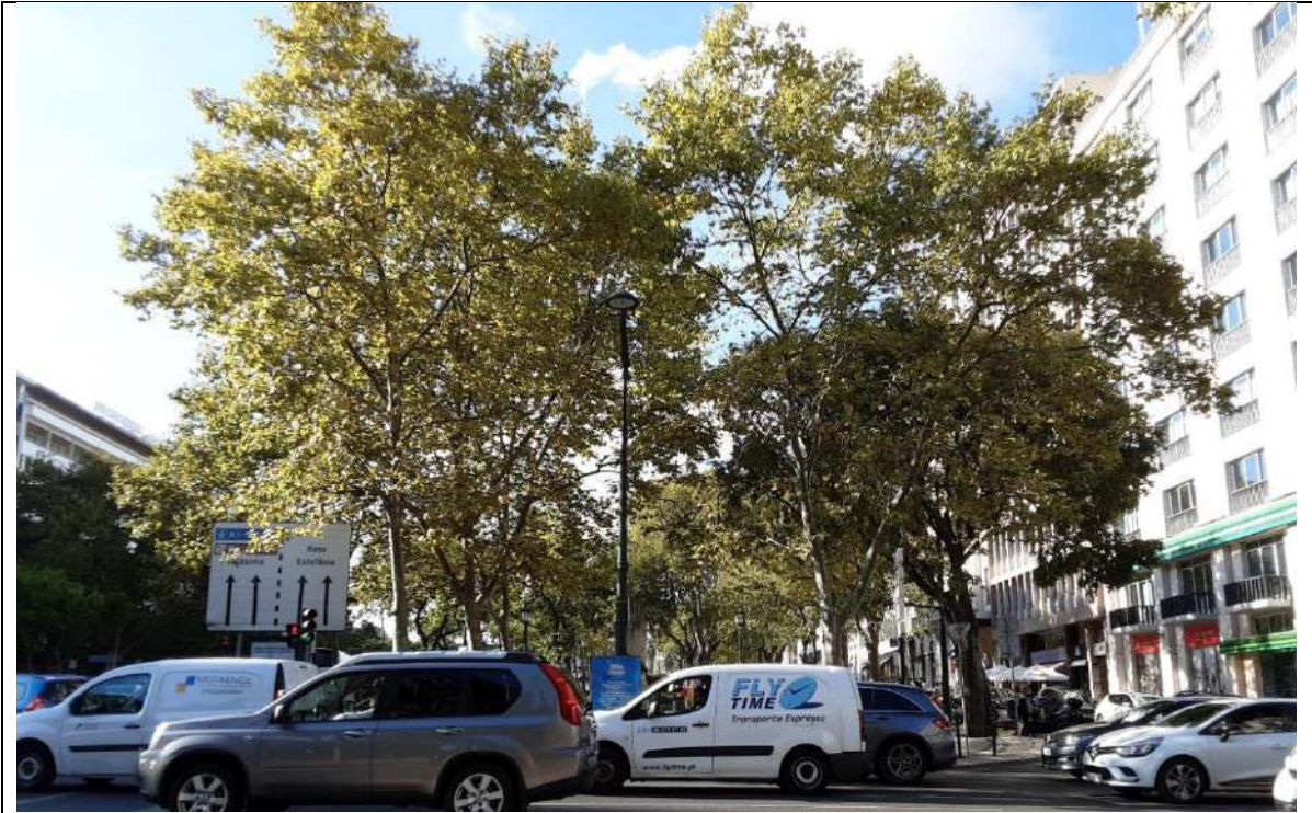
Exemplar Cod. SIG 8150 - Platanus x hybrida