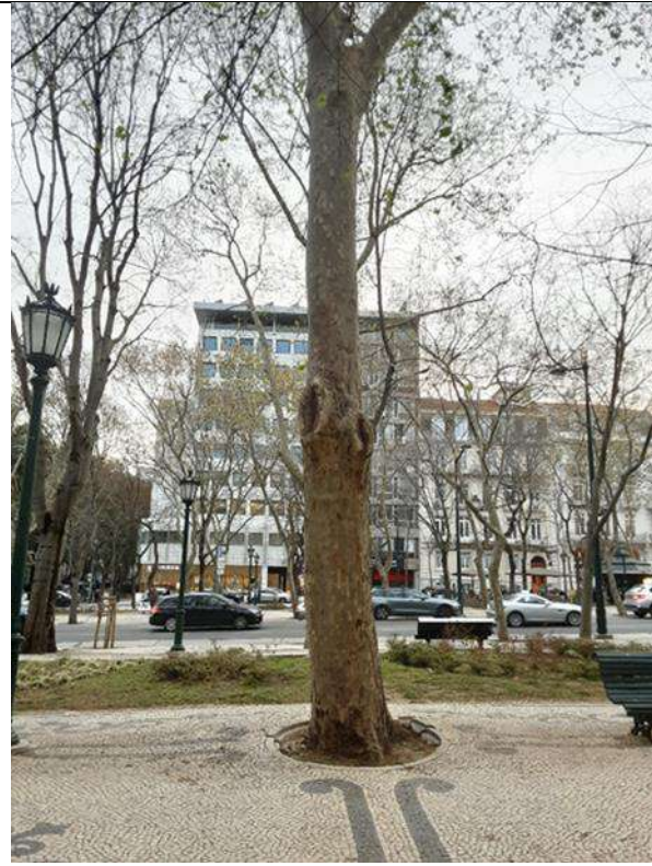
Exemplar Cod. SIG 8687 - Platanus x hybrida