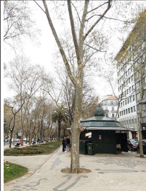
Exemplar Cod. SIG 8205 - Platanus x hybrida