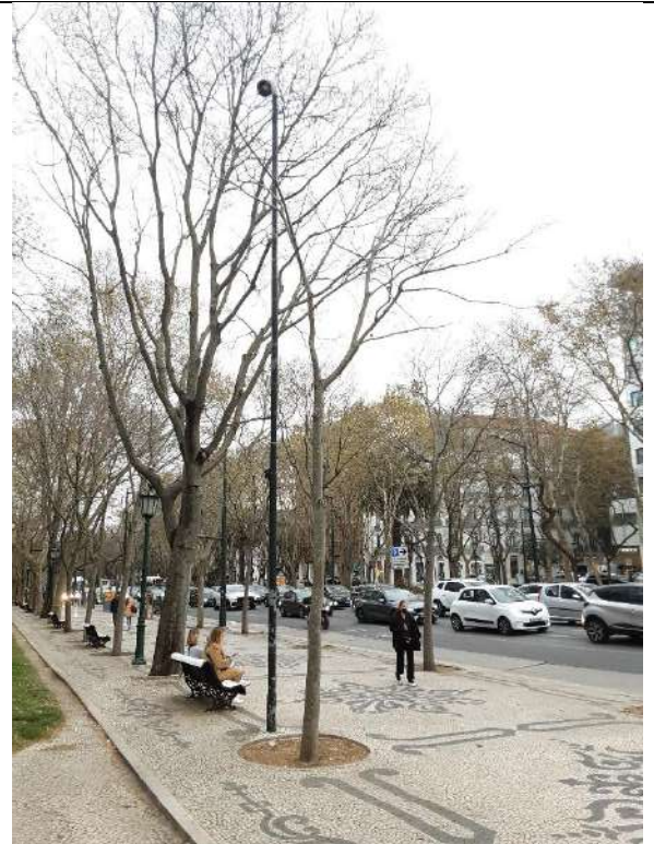
Exemplar Cod. SIG 8563 – Celtis australis