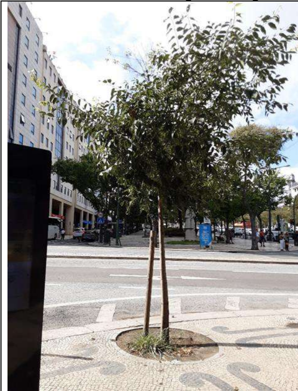
Exemplar Cod. SIG 8414 - Celtis australis