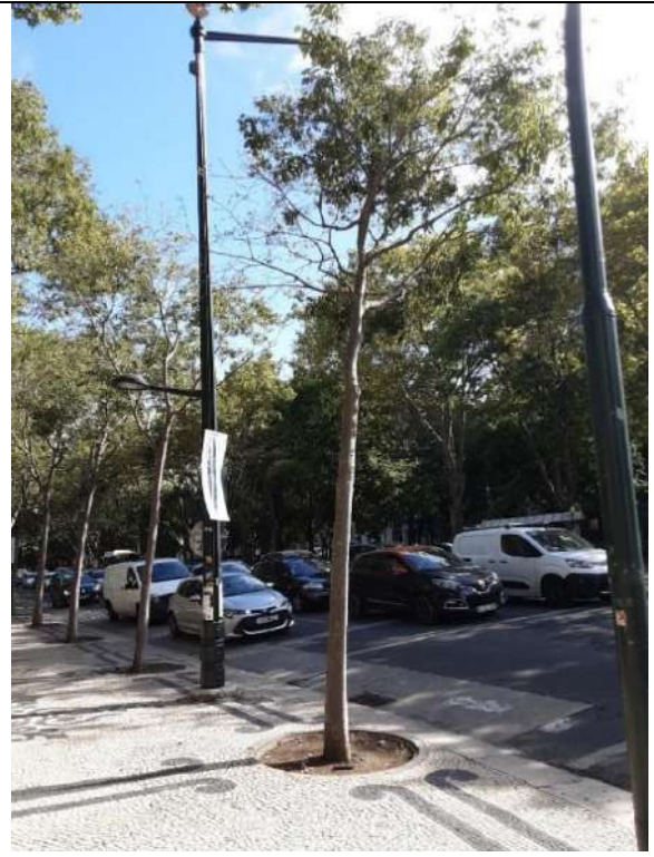
Exemplar Cod. SIG 8572 - Celtis australis