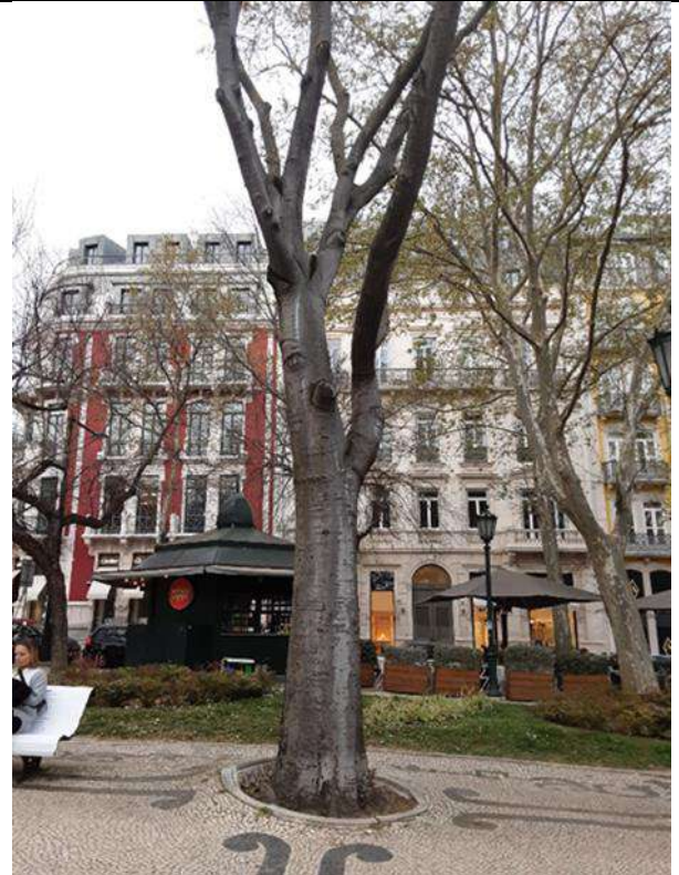
Exemplar Cod. SIG 8488 – Celtis australis