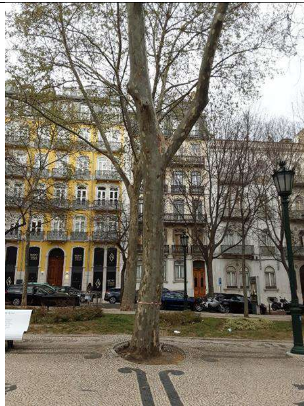
Exemplar Cod. SIG 8838 - Platanus x hybrida